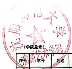
戏剧艺术学本科生综合素质测评结果 2022-2023学年2020级表演专业 文体测评成绩